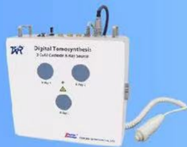
ポータブルX線断層撮影装置 TXR-MC3R120PS-01