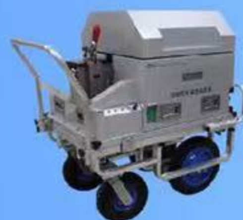
可搬型X線電線端検査装置