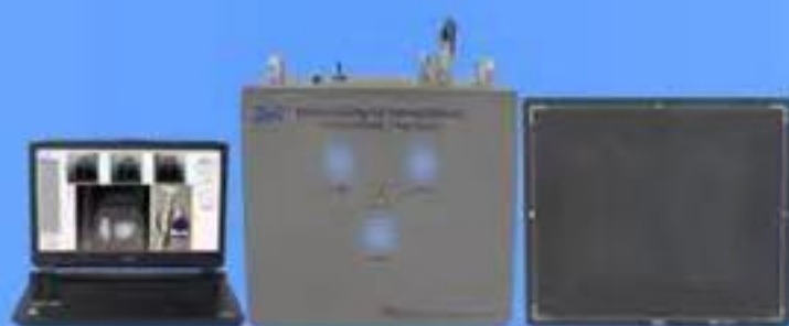
ポータブルX線断層検査装置 TXR-C3R150PS-01