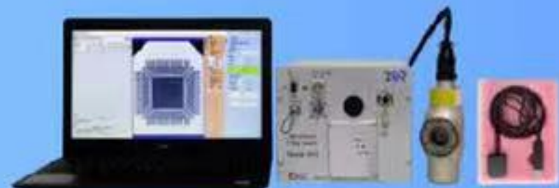
マイクロフォーカス X線検査装置（熱陰極） TXR-H1R50PS-01