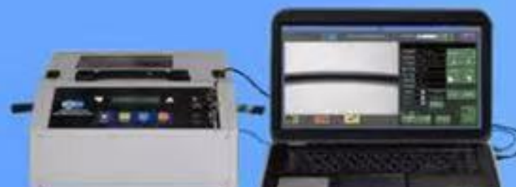
卓上小型X線検査装置 TXR-C1R120PS-01