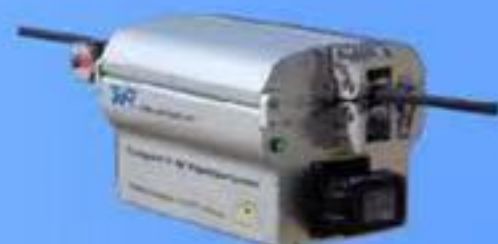
自走式電線検査装置 TXR-C3R120PS-02