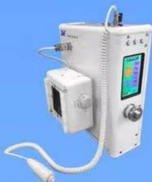
医療用ポータブルX線源 TXR-MC1R120P-03