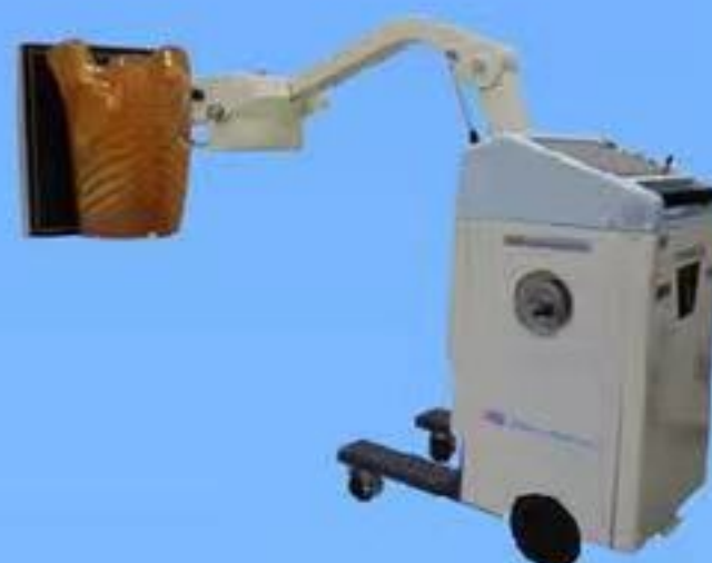
可搬型X線断層撮影装置 TXR-MC4R120PS-03